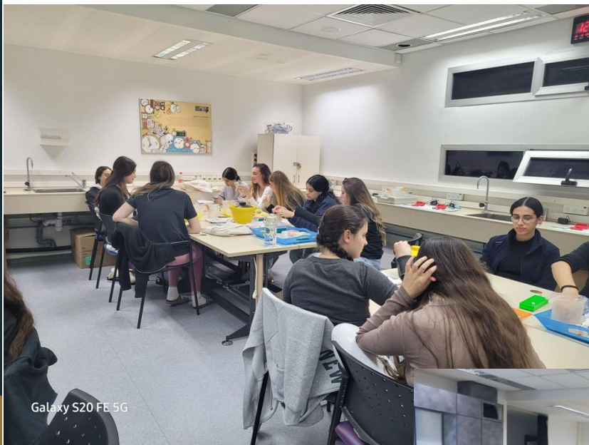
Galaxy S20 FE 5G