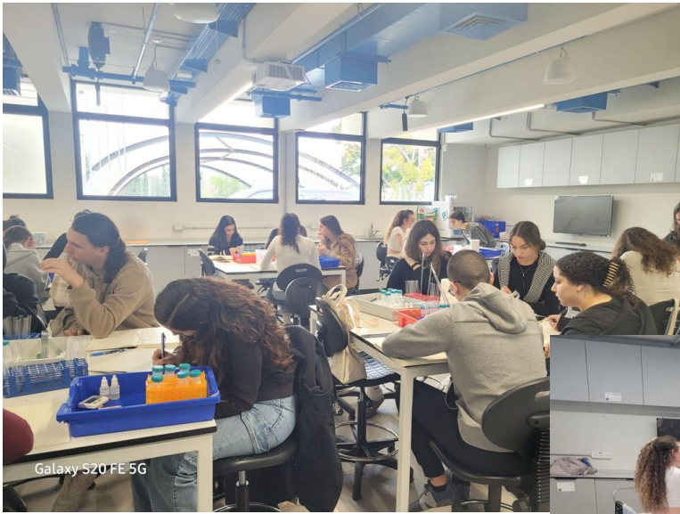
Galaxy S20 FE 5G