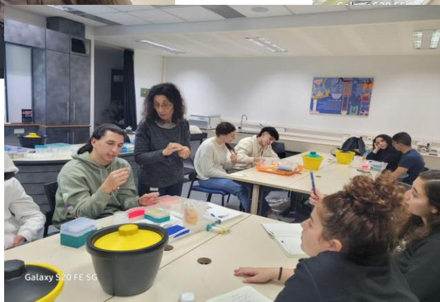
Galaxy S20 FE 5G