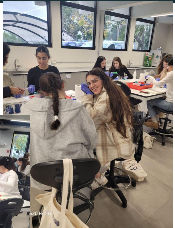
S20 FE 5G