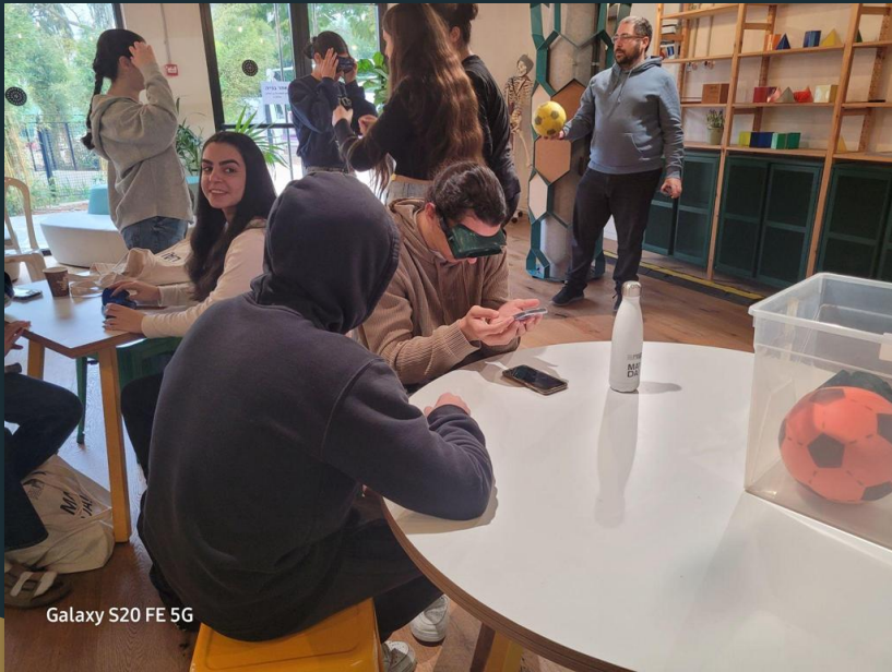
Galaxy S20 FE 5G