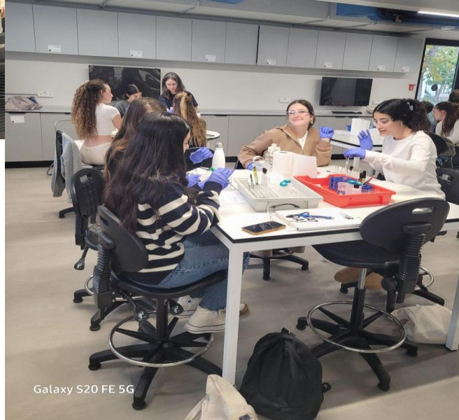
Galaxy S20 FE 5G