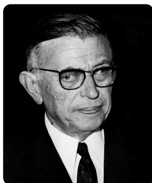
ז'אן פול סארטר